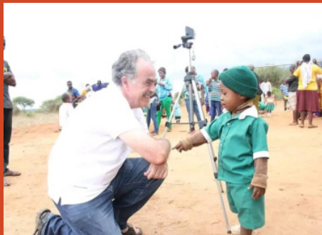
Einweihungstag des Kindergartens 2017: