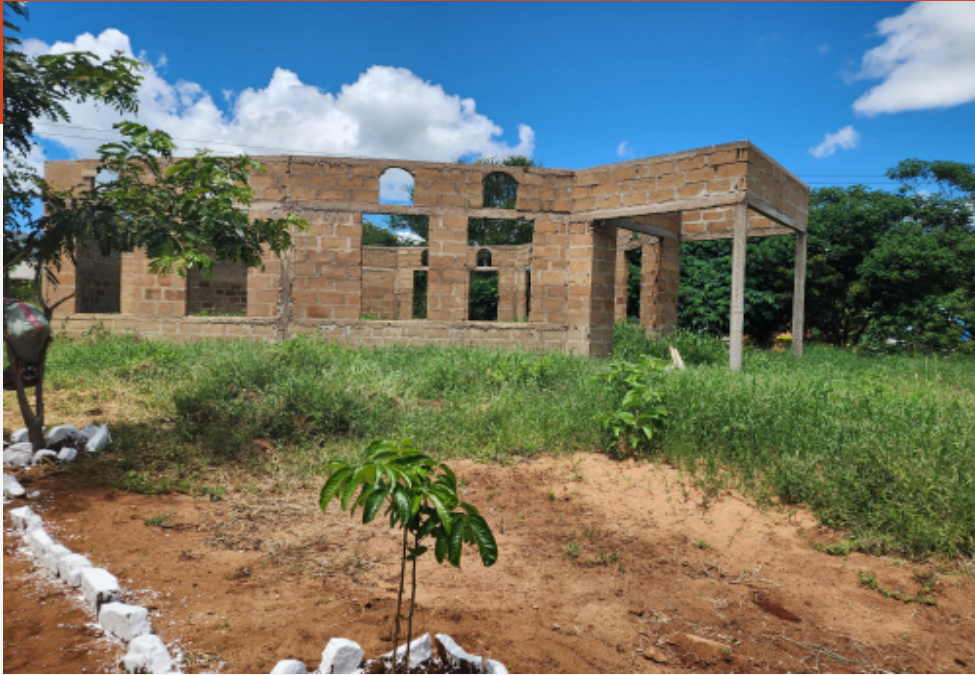
Neubau der Kirche, finanziert aus örtlichen Spenden der Gemeindeglieder Ishindes